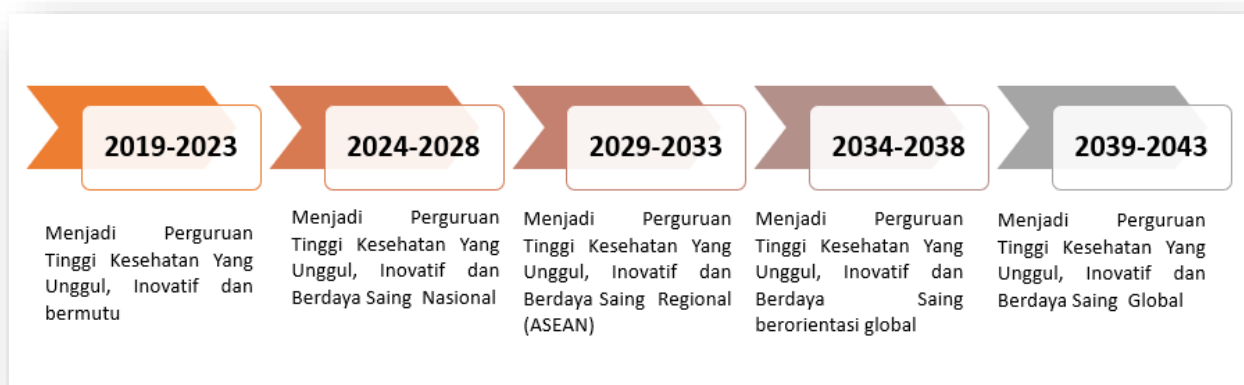
Gambar Tahapan Pencapaian Milestone STIKES Guna Bangsa Yogyakarta